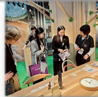
台北国際建築建材及び産品展への出展