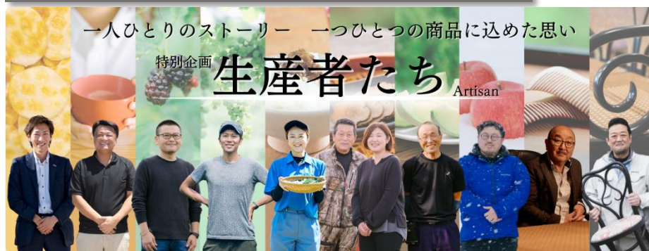
生産者のこだわりや想いを記事にした「生産者たち」