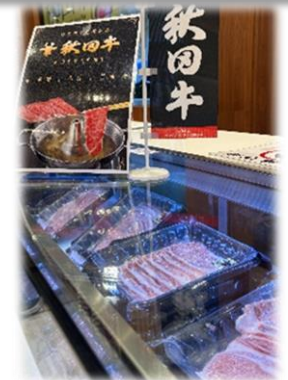
台湾での青果物・秋田牛プロモーション