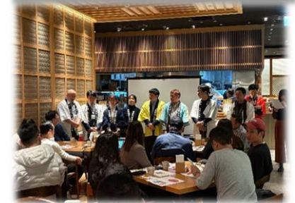
台湾での青果物のプレゼン会