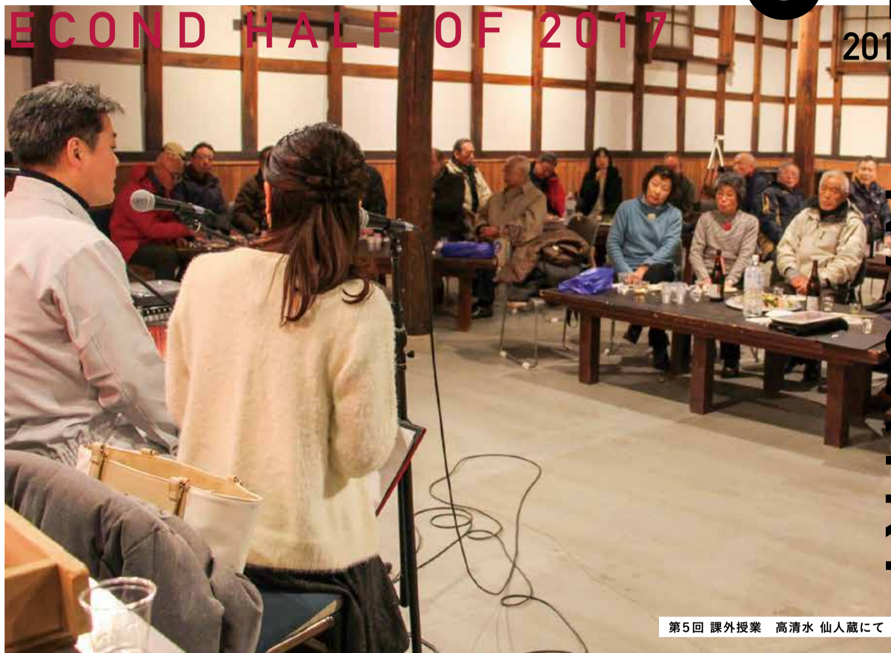
第5回 課外授業 高清水 仙人蔵にて