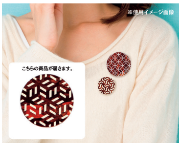
※使用イメージ画像

伝統の樺細工に新技術を融合したKAVERS。山桜の樹皮に繊細な伝統文様を彫り、色を流し込み研ぎ出しました。厄除けや成長を願う「麻の葉文様」が、伝統を日常に引き寄せます。暮らしを彩る上質な一品です。