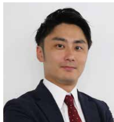
株式会社日本M&Aセンター 秋田事務所 所長